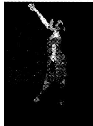
L'histoire se passe le soir de Noël.

Représentations vendredi à 19 heures, samedi et dimanche à 17 heures, à l'Espace Vélodrome.