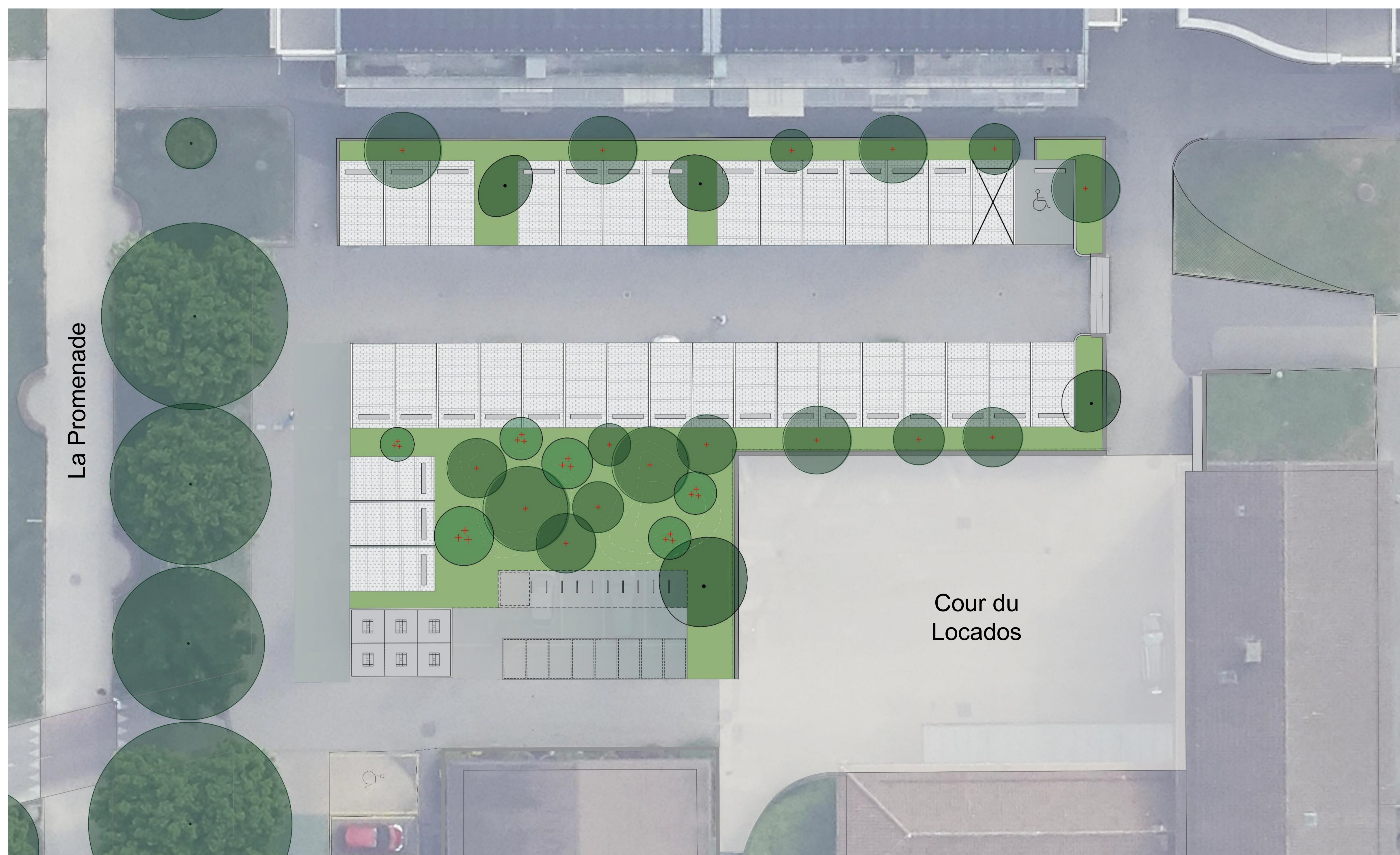
Plan du projet de réaménagement