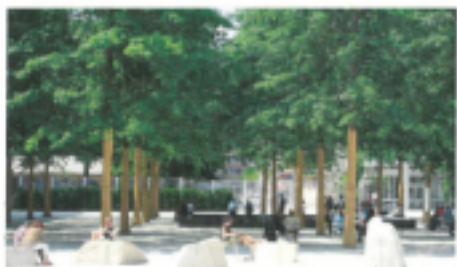
Campos de Novartis (Milan)