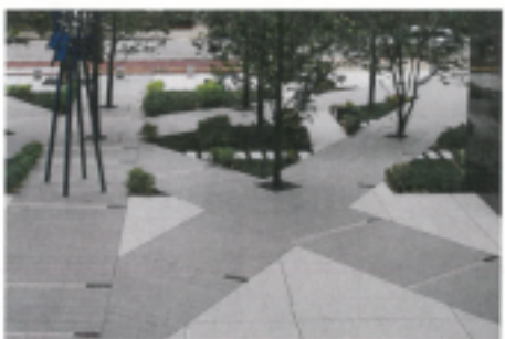
Fukuoka Bank Headquarter (Japan)