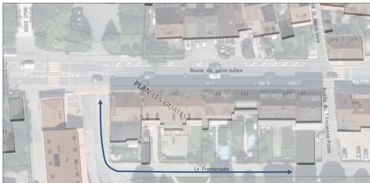
Figure 3 : schéma du maintien de l'accès à l'arrière des numéros 147 à 161 Route de Saint-Julien

Il en est ressorti une image directrice (annexe 3a) comprenant les éléments suivants :