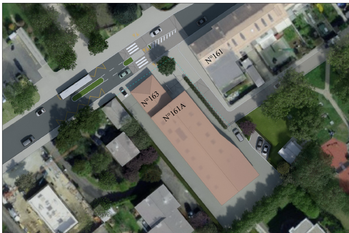
Figure 4 : image directrice issue de l'étude préliminaire