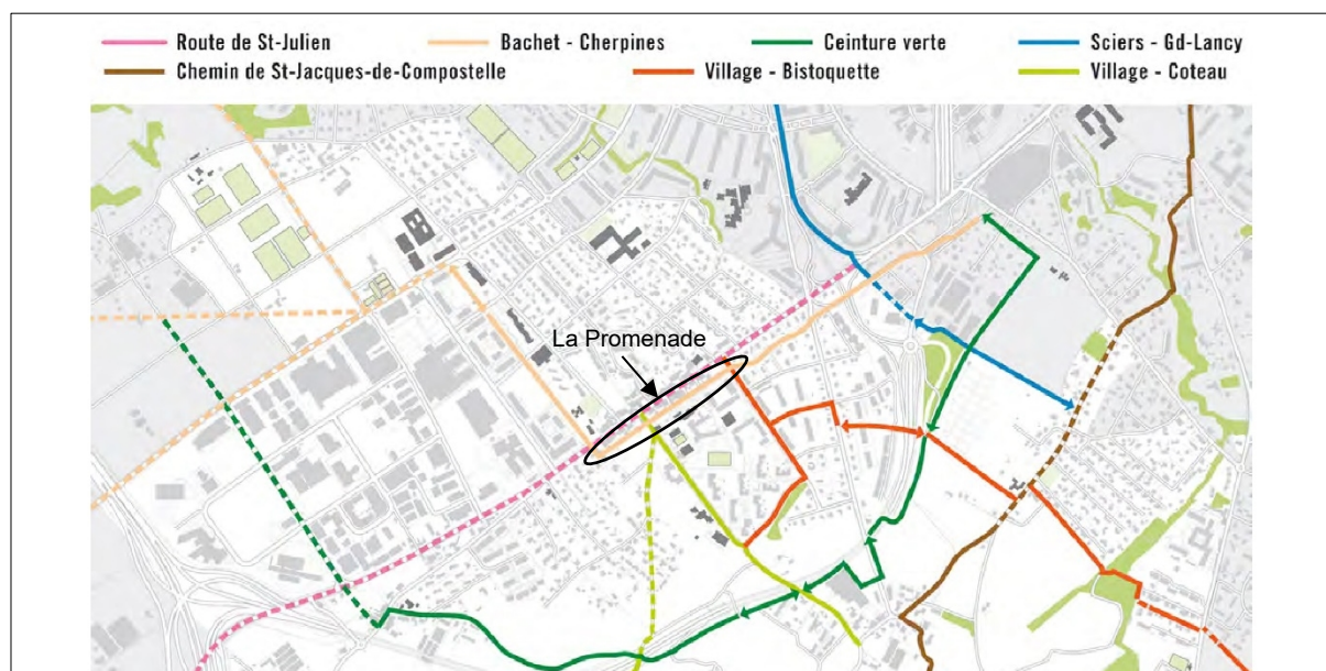
Figure 1 : la Promenade dans le réseau de mobilité douce de la Commune

Extrait du rapport final du Plan directeur des chemins pour piétons et Schéma directeur du réseau cyclable N° 29'873