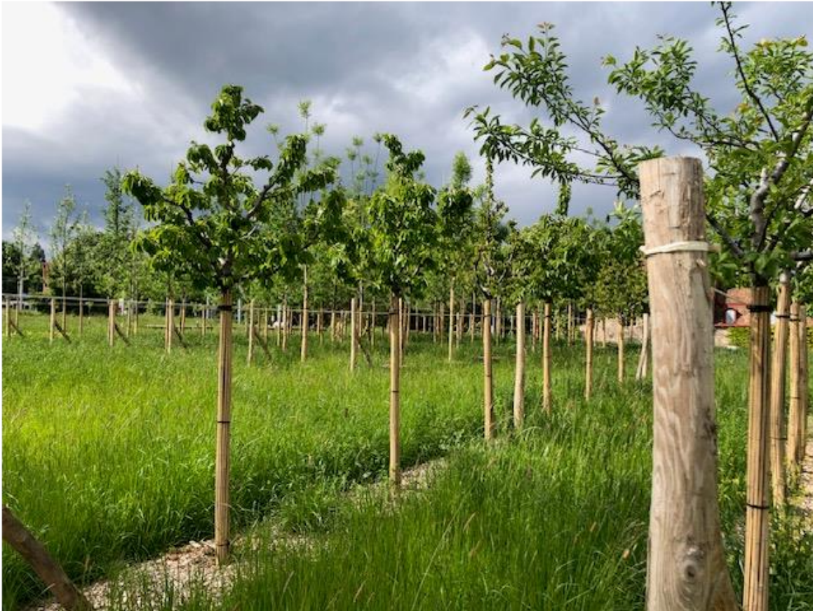
Pépinière urbaine au Parc Rigot en Ville de Genève ( environ 250 arbres )