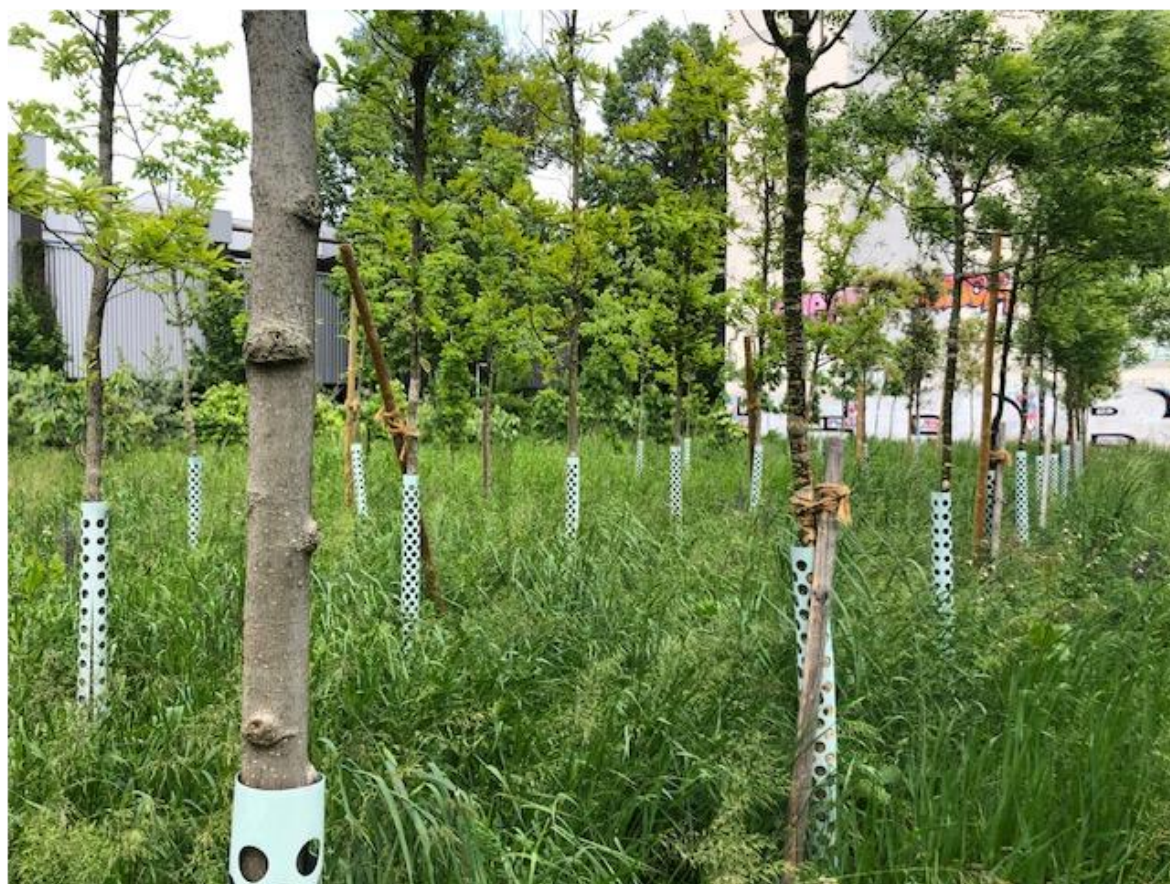
Pépinière urbaine – parc Crozet à Vernier (environ 170 arbres)