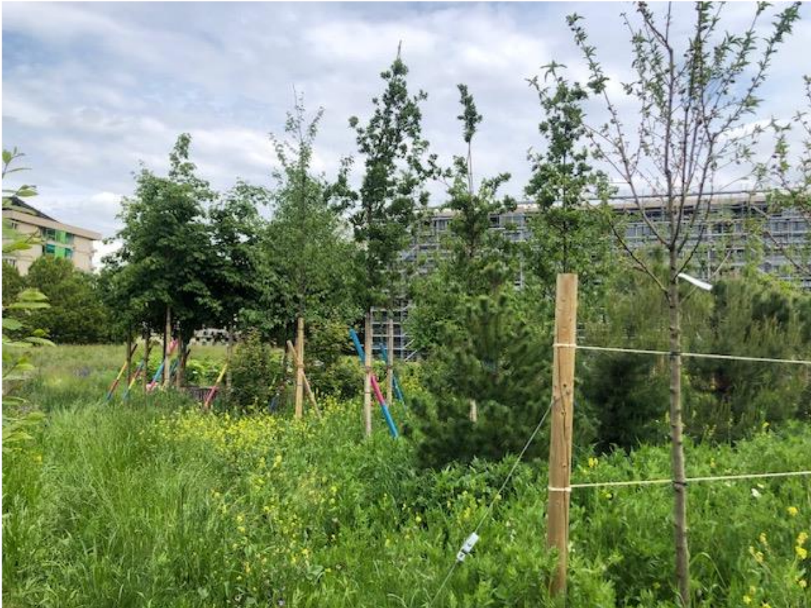
Pépinière urbaine du collège André-Chavanne en Ville de Genève ( environ 250 arbres )