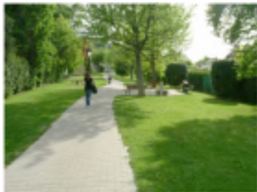
Figure 2 : Promenade tordue