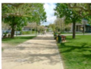
Figure 3 : Promenade