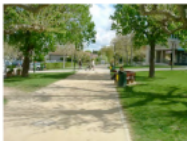
Figure 3 : Promenade