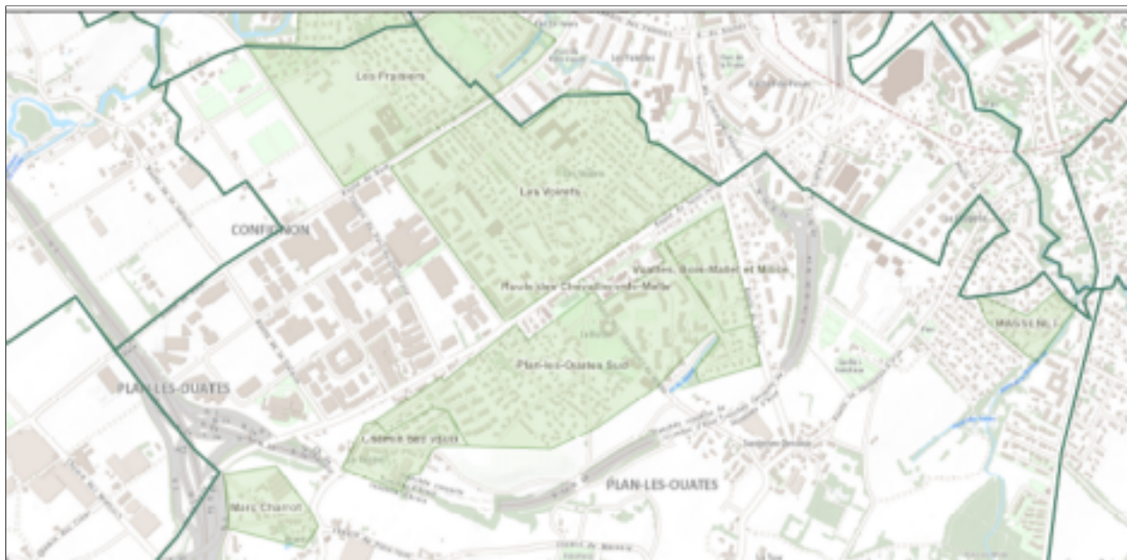
Figure 1 : zones de rencontre et zones 30 de la Commune de Plan-les-Ouates

Comme l'illustre la figure 1 ci-dessous, une grande partie des voiries du tissu urbanisé de la Commune est en zone 30 ou en zone de rencontre. L'ensemble de ces voiries se situent sur le réseau de quartier communal non structurant.