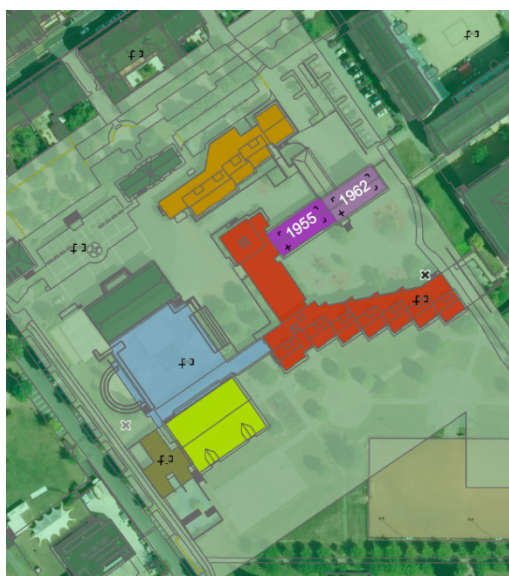
Localisation des affectations du complexe

Situé au cœur de la commune de Plan-les-Ouates, le complexe scolaire du Pré-du-Camp constitue un équipement public majeur, développé progressivement par extensions successives afin de répondre à l'évolution des besoins scolaires du territoire. Il regroupe aujourd'hui plusieurs bâtiments scolaires (Boymond, Pré-du-Camp CE et CM), ainsi qu'une bibliothèque, un gymnase, une piscine et des locaux dédiés aux activités parascolaires.