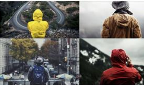
Mobilisation de fin d'année

La collecte de dons commence aujourd'hui 🍷🍷🍷