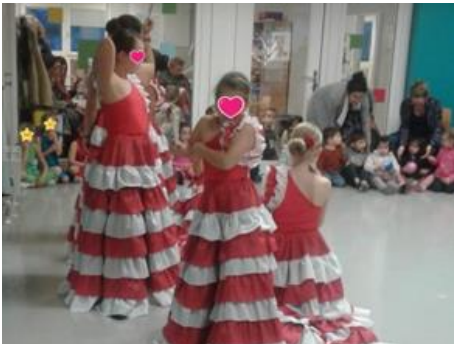
Champ Ravy 11 décembre 2019 · 🌐

La collecte de dons commence aujourd'hui 🍷🍷🍷