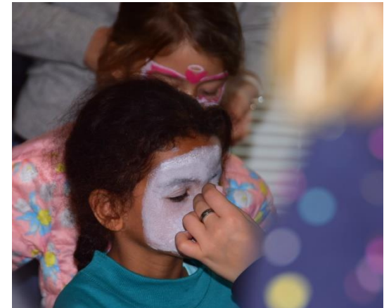
Champ Ravy 23 novembre 2019 · 🌐